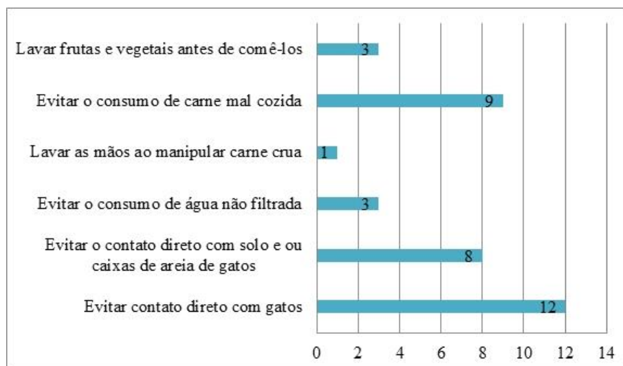
Figura 3. Quantificação das respostas positivas quanto às medidas preventivas primárias da Toxoplasmose.

totalizando 29 (65%), enquanto 13 (29%) possuíam conhecimento limitado, uma (2%) com conhecimento moderado, uma (2%) com conhecimento substancial e uma (2%) com conhecimento extenso.