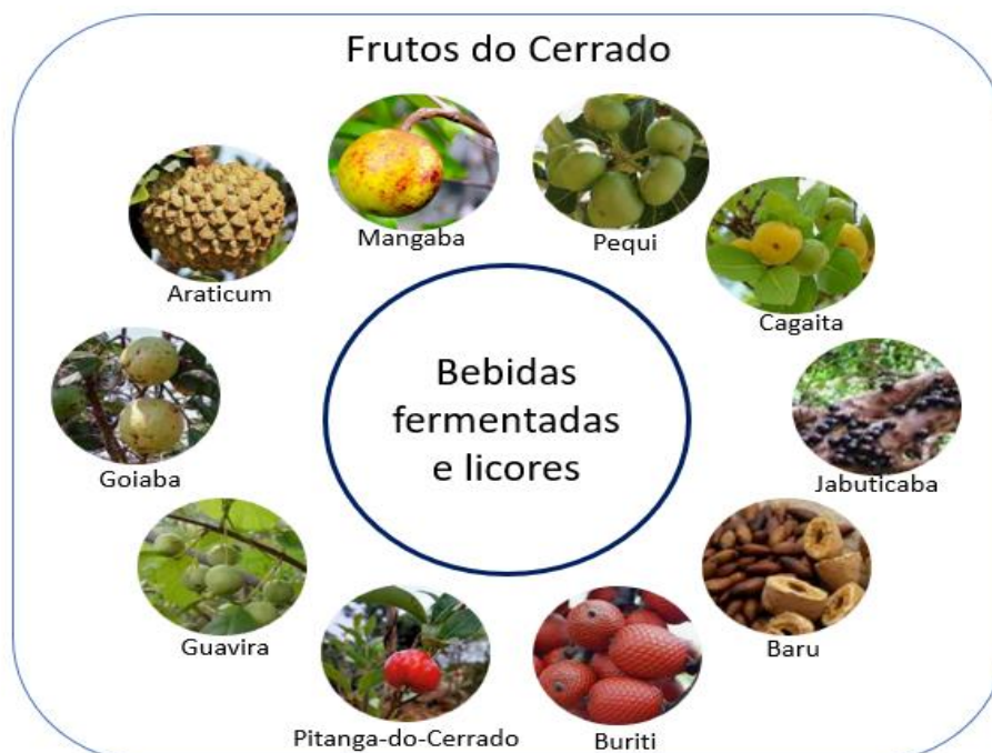
Figura 2. Frutos do cerrado com potencial para elaboração de produtos fermentados.

O interesse pelos frutos do cerrado e suas aplicabilidades, perpassa pela preservação das espécies nativas, pelo perfil de compostos bioativos e pela agregação de valor. Esta motivação tem despertado estudos principalmente sobre o potencial tecnológico voltado a possibilidade de uso em diferentes processos. Os frutos do cerrado são constituídos por inúmeros compostos além de apresentar características peculiares, dentre eles podemos destacar alguns como pequi, cagaita, baru, jabuticaba, araticum entre outros (Figura 2).