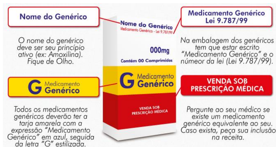
Figura 01 Embalagem dos medicamentos Genéricos. 17

O preço do medicamento genérico é menor, pois os fabricantes de medicamentos genéricos não necessitam realizar todas as pesquisas que são realizadas quando se desenvolve um medicamento inovador, visto que suas características são as mesmas do medicamento de referência, com o qual são comparados. 16